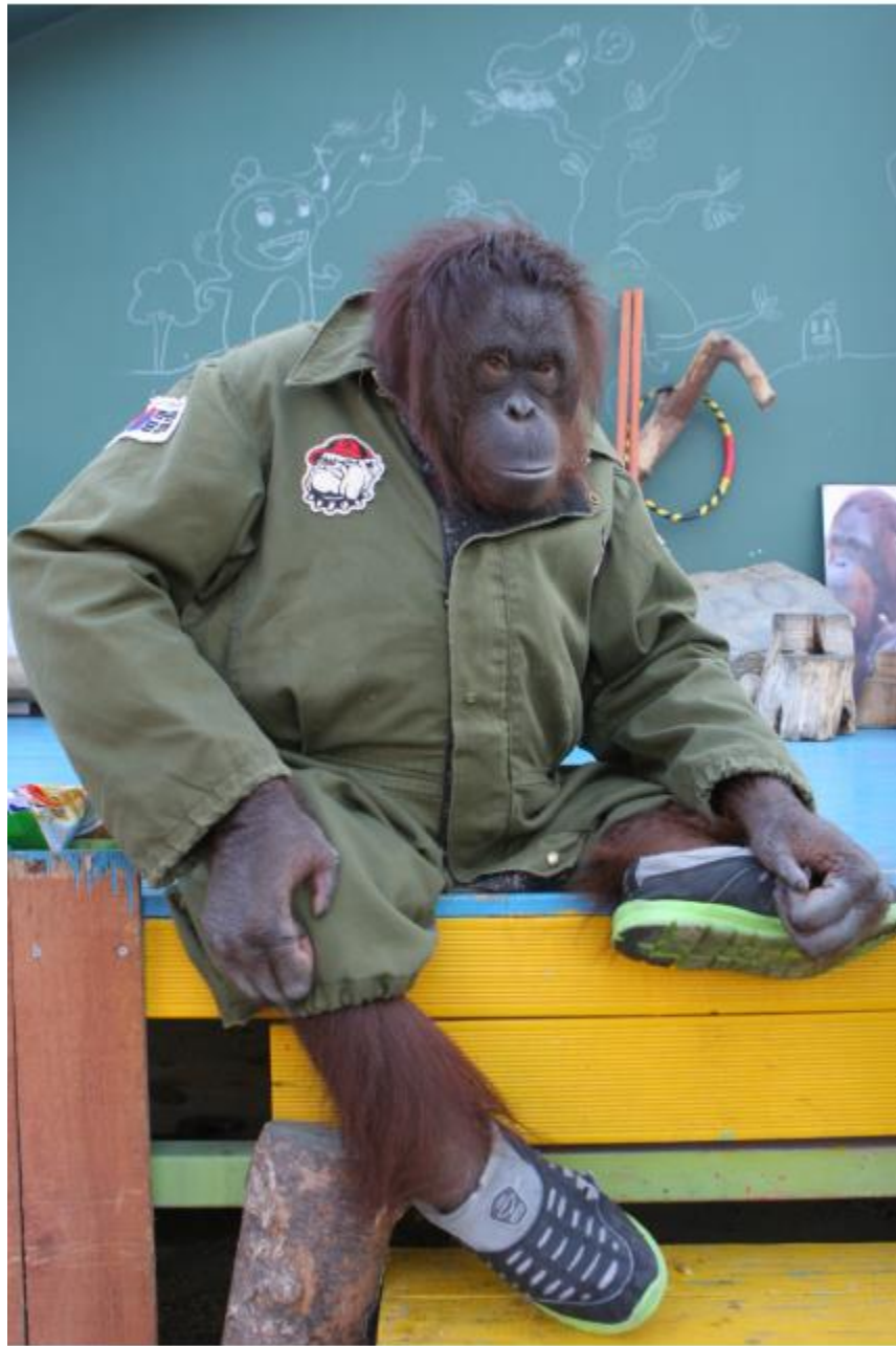
오랑 - 주주동물원 공연중