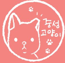
Return 제자리 방사

TNR(포획-중성화-제자리방사)은 길고양이를 포획하여 중성화수술 후 제자리방사하는 국가 정책으로 전국 지자체에서 시행하고 있습니다.